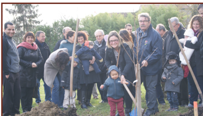
Des arbres & des naissances en 2015

TOUT AU LONG DE L'ANNÉE Rencontres et tournois sportifs, concerts, lotos, théâtre, expositions, cinéma, vide-grenier, etc.