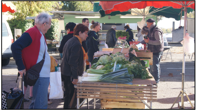
Marché hebdomadaire place Étienne Bouet