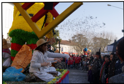
Carnaval de Layrac